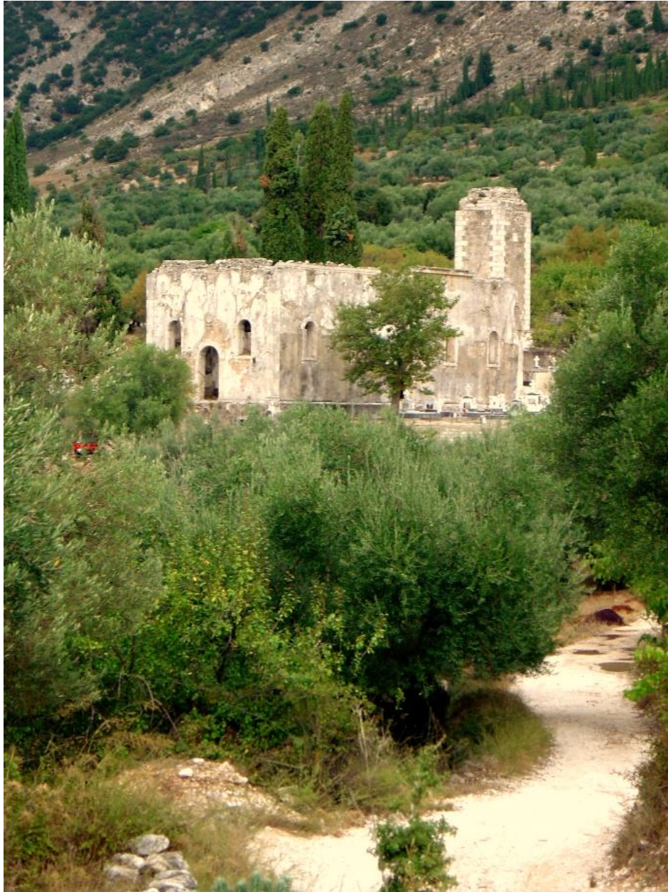
Ιερός Ναός Ταξιαρχών Βαλασαμάτων